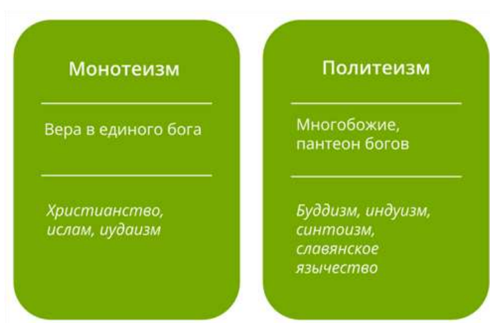
Рис. 2. Монотеизм и политеизм

В зависимости от количества божеств, которым поклоняются, выделяют религии монотеистические и политеистические.