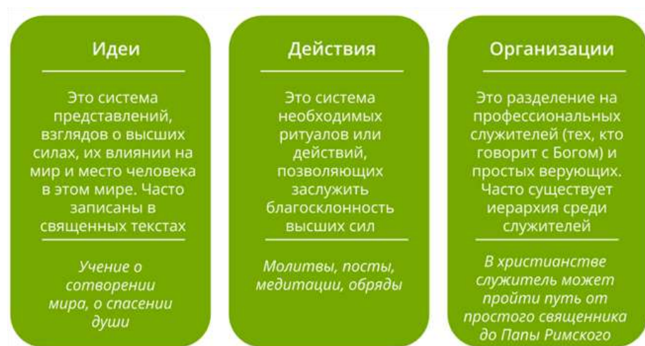
Рис. 1. Структура религии

Структура религии включает религиозное сознание (идеи), религиозный культ (действия) и систему религиозных организаций.